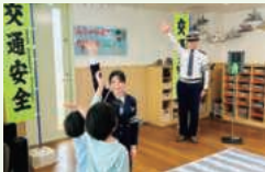
信号機を見て 横断歩道を渡る実技