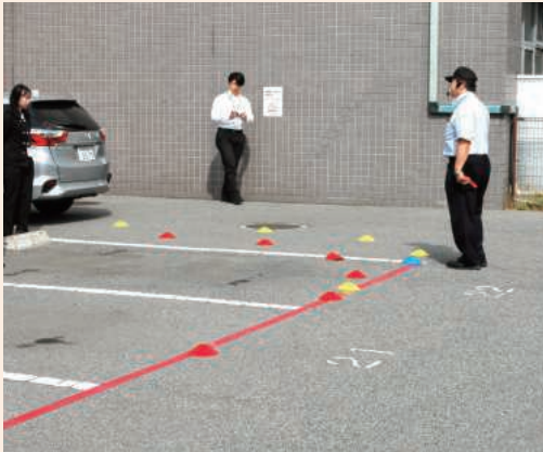
前輪と後輪の軌道の差 (内輪差の認識)

令和8年4月23日、本四高速道路ブリッジエンジニアリング株式会社、5月13日、県内官公署において当協会の講師が事故状況に応じた再発防止講義と車庫入れ等の実技指導を実施しました。 講師は、県警OBで数多くの悲惨な交通事故捜査を担当した経験豊富な元交通警察官。交通事故を防ぐたった2つの方法は「危険の予測運転」と「交通事故の怖さを知ること」と言い切ります。 自身の経験を基にした講義は、受講された方々の心に強く訴えるものがあり、中には目頭を押さえる方もおられました。