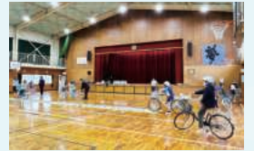
難しいデコボコ走行の練習

令和8年4月30日、自由が丘東小学校は、児童の自転車クラブを結成しました。クラブ児童11人は、毎週2回、放課後に練習を行います。小学生から自転車の交通ルールを学ぶことは、自身の身の安全を守ることにつながるので大切です。