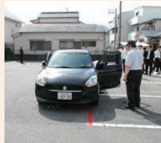
左側面の車幅間隔