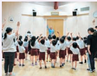
横断歩道は手をあげて