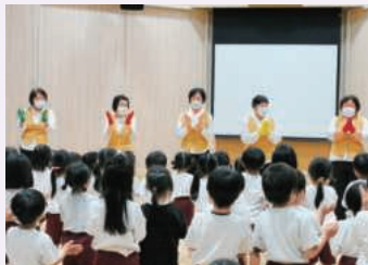
信号機手袋で「むすんでひらいて♪」

令和8年5月18日、「陽光こども園」において園児の交通安全教育を実施しました。 おまわりさんの交通安全のお話しの後、婦人部さんが紙芝居やお遊戯、映画の視聴を通じて園児と「道路に飛び出さない」「信号を守ります」などの交通安全のお約束をしました。