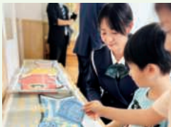
交通安全の願い事を 貼り付ける園児