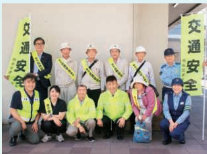
キャンペーン参加の皆様