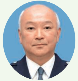
兵庫県警察本部 交通部長