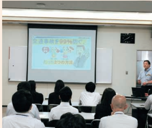
スクリーンを使用した講義