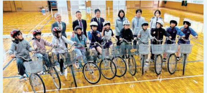
自転車クラブ児童