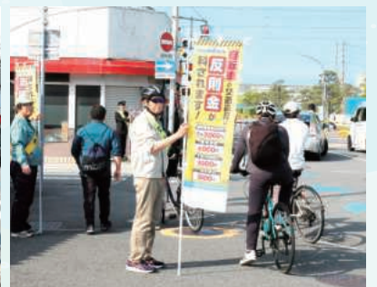
安全利用の啓発状況