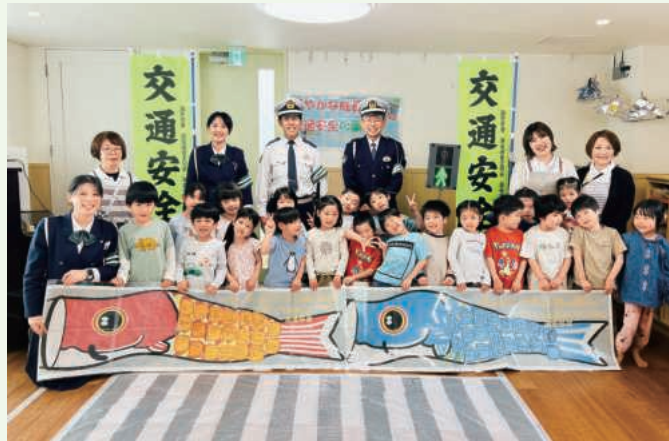
園児たちと交通安全鯉のぼり

令和8年4月24日、「認定こども園高羽COCORO」において「きらきらえがお組」の園児20人が「みんなでこうつつうあぜん」と題した鯉のぼりを作成し灘署へ寄贈しました。 交通安全指導員から「信号機のお約束」を学び、実際に信号機の色を見て横断歩道を渡る実技をした後、「とびだしはしません」などと記載した願いごとを鯉のぼりに貼り付けました。