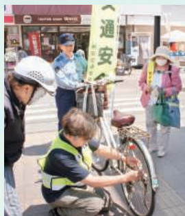
反射リフレクターの取付け

令和8年5月15日、明石交通安全協会と明石署は、JR西明石駅前ロータリー付近において、自転車の交通安全街頭キャンペーンを実施しました。