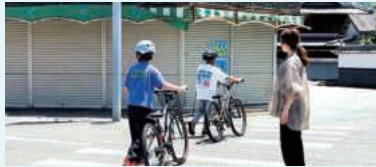
校外での交通安全指導

令和8年5月15日、西脇多可交通安全協会と西脇署は、西脇市と西脇市立楠丘小学校PTAと連携し、同小学校において自転車の交通安全教室を開催しました。