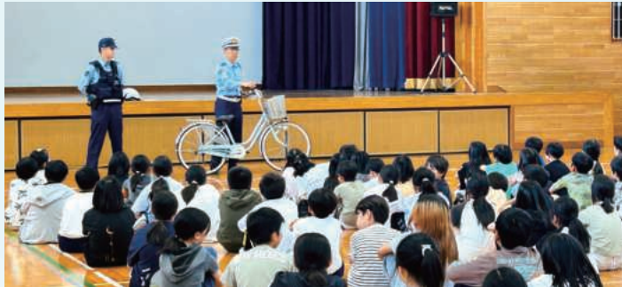
自転車の点検方法等