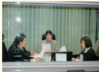
スタジオ収録状況