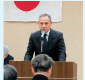
難波専務理事主催者