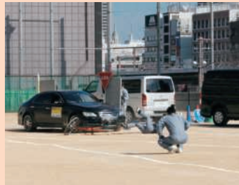
交差点での出合頭事故