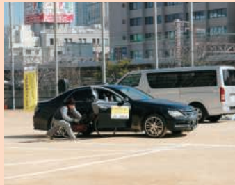
後方不確認ドア開け事故