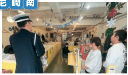
尼 崎 南