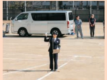
自転車事故現状の講話