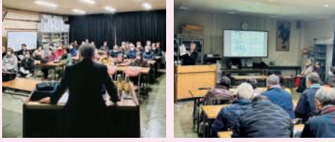
HP交通安全ハンドブック HP講習講師派遣依頼書