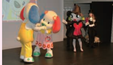
みんなで楽しい交通安全クイズ