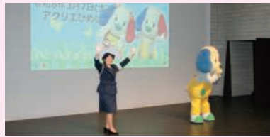
ルールくんと交通安全指導員さん