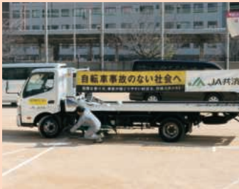
貨物車の左折巻き込み

事故の再現では、実際に衝突した際の衝撃音やスタントマンが事故に遭う状況を見て本当の交通事故の恐ろしさを疑似体験し、自転車運転中の交通ルール遵守の大切さを学びました。