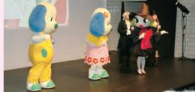
ルールくんとマナーちゃん、マジョリーヌとその仲間たち