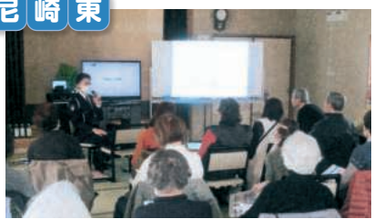
尼 崎 東