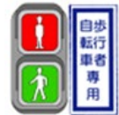
「歩行者・自転車専用」

② 信号無視は、反則行為です。違反すると反則金(6,000円)の対象となります。