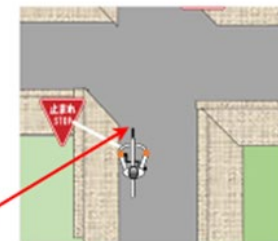
停止線がなければ、交差点の直前で停止